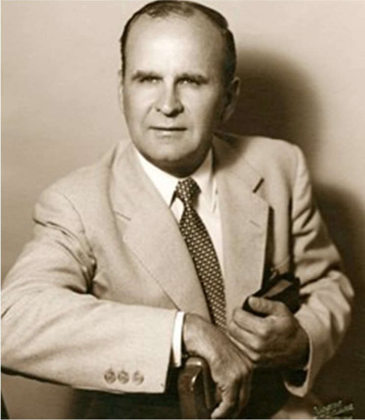
WILLIAM MARRION BRANHAM